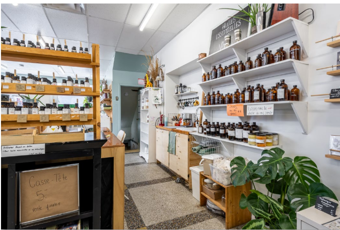
Espace arrière // Back area