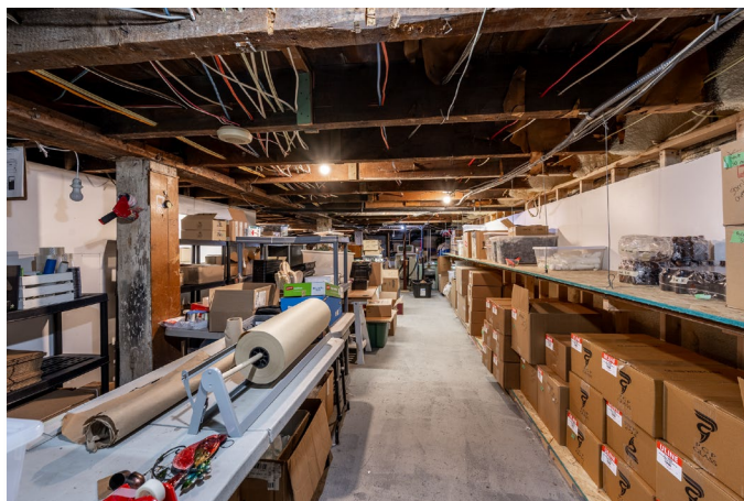
Espace de stockage // Storage space